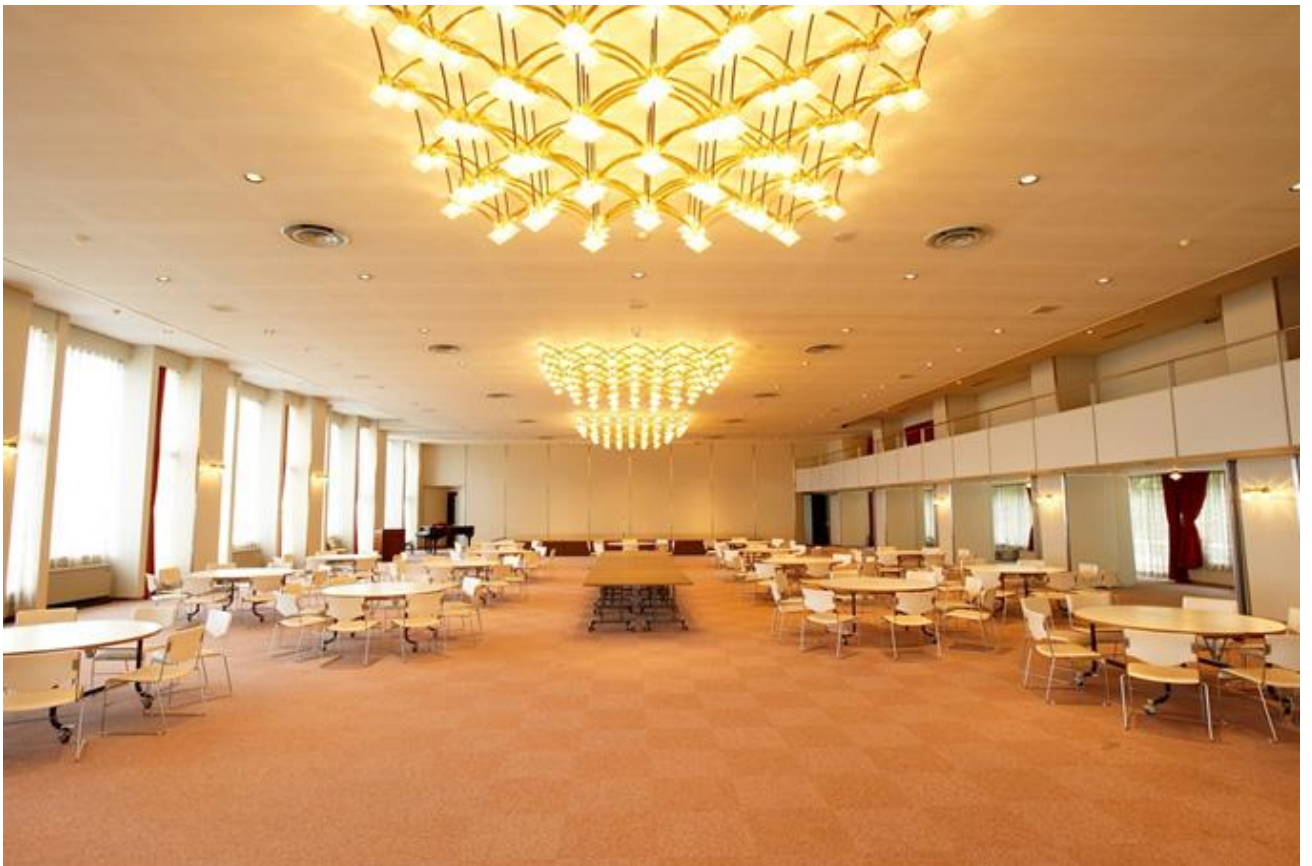
福山記念館Aホール